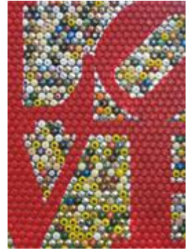
Armelle Blary (1-2) – Clotilde (3) – Sylvia Lacaisse (4-5)