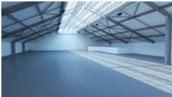
SLICK à Paris en octobre 2012 au GARAGE 66 rue de la Turenne, 75003 Paris

Cette année, SLICK investit un nouvel espace situé dans le Marais à Paris, le quartier phare des galeries d'art contemporain. SLICK s'installe ainsi au cœur de la vie artistique. A deux pas du Musée Picasso, la foire se déploie sur les deux plateaux sous verrière du Garage, bâtiment moderniste construit en 1937 et logé dans une cour typique du passé ouvrier du Marais.